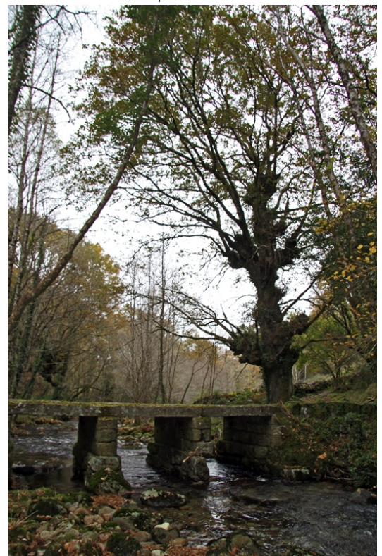
Pontella entre Meilide e Cabenca

Unha camiñada para percorrer o val do río do Seixo, linde do espazo protexido LIC Serra do Cando, en Cerdedo. Ao río Seixo dalle nome o monte no que nace, o monte do Seixo, cume sobranceiro e mítico da serra do Cando, da Dorsal Galega, na Terra de Montes. Un río de curto percorrido pero cargado de atractivos en forma de muíños, pontellas, pozas, fervenzas, vexetación circundante, historias e lendas. Unha camiñada que se fai en gran parte por dentro das carballerías que medran no fondo do val, a case todo o longo do percorrido, na que non faltan exemplares de máis de catro metros de perímetro e outros de menos grosor pero de moi bo aspecto e vigoroso porte, aos que acompañan algúns acivros, pereiras bravas e outras árbores de menos desenvolvemento propias do entorno, e nas marxes do río salgueiros, abeleiras e bidueiros. Por enriba deles cubren o monte toxos, xestas e breixos.