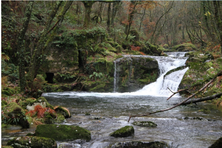
O Pozo Fumegas