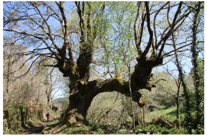
Carballo de 4,64 m de perímetro á beira do río Seixo en Cabenca