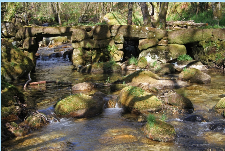
Pontella no camiño da Cavadosa