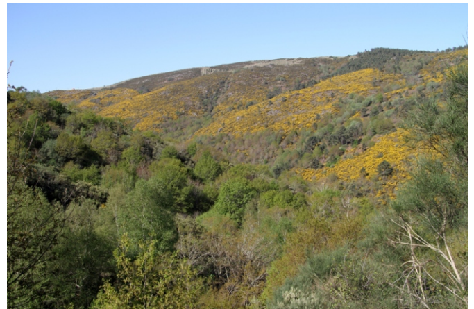
Val do Seixo e Outeiro dos Carpinteiros

Camiño pola carballreira. Nesta carballreira descubriuse recentemente unha nova especie de cogomelo, única no mundo, á que se lle deu o nome de Ramaria Cerdedensis .