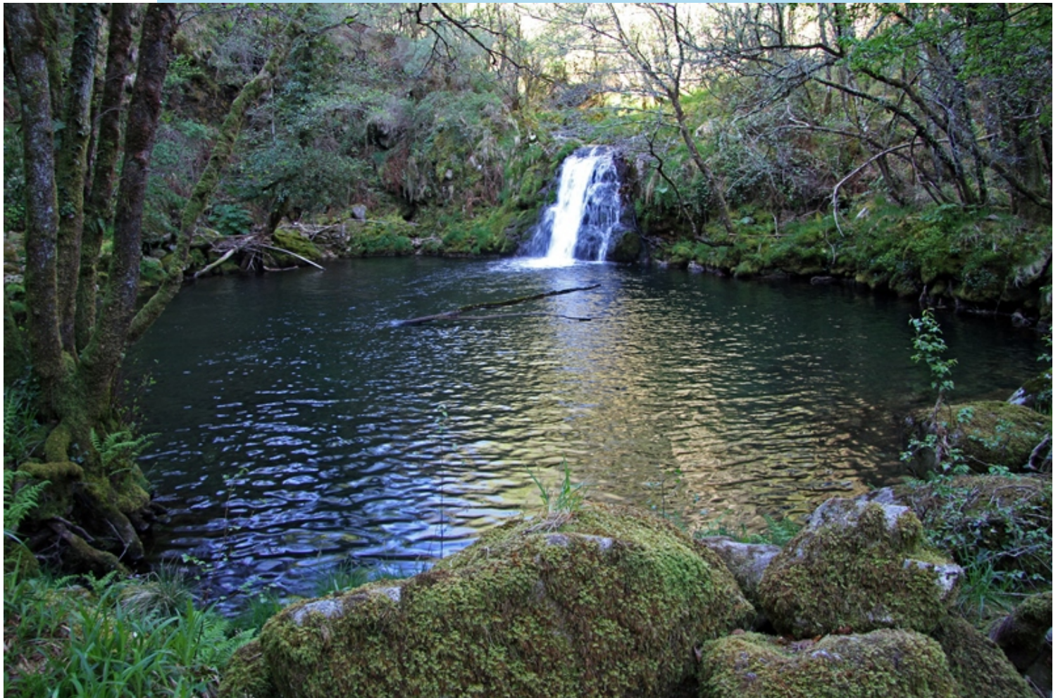
O Pozo Sangoento