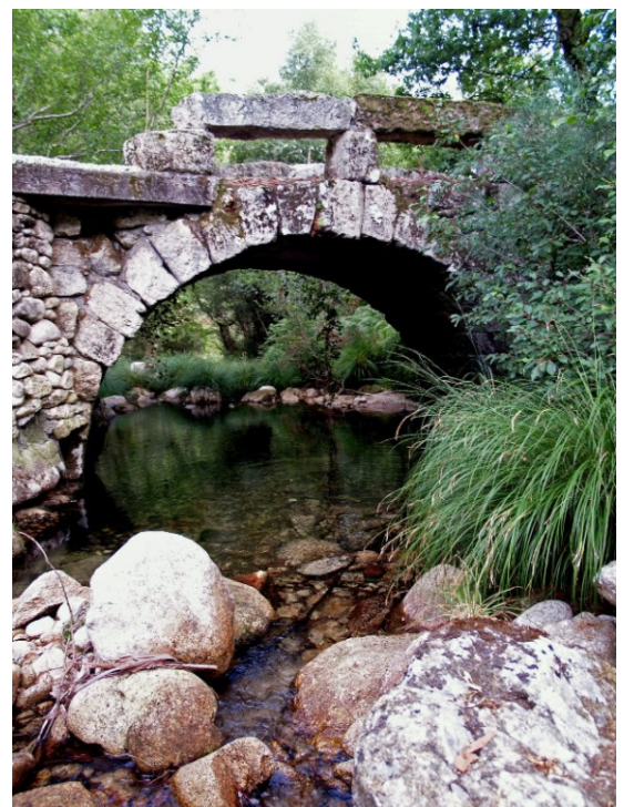
Ponte medieval da Cavadosa