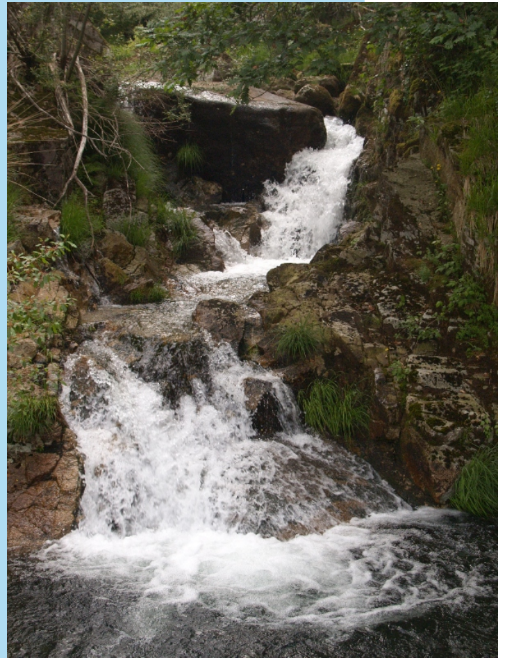
Feixa da Cavadosa